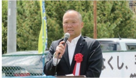
働く皆さんを代表して行政に訴えます