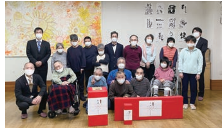
東芝労組の社会貢献活動(カンパ寄贈)