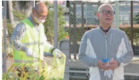
地域のボランティア活動にも積極的に参加