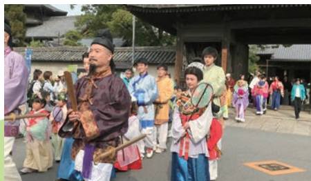
歴史と文化を次の世代に継承します