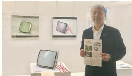
産業の活性化のため、企業誘致を推進