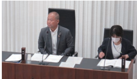
議長・副議長として議会を円滑に運営